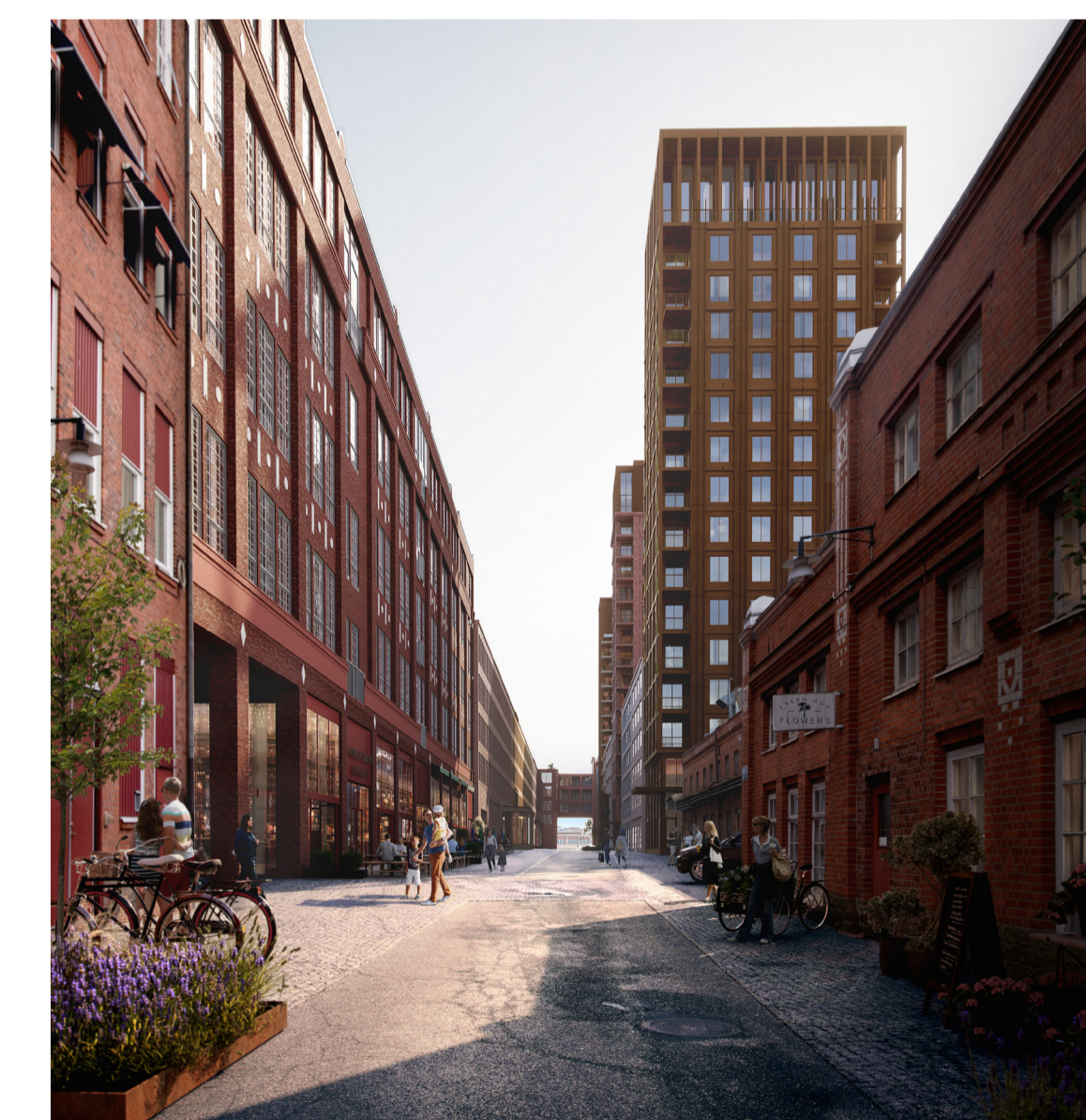
Rullagergatan, vy från väster, ett parallellt och livaktigt stråk till Artillerigatan