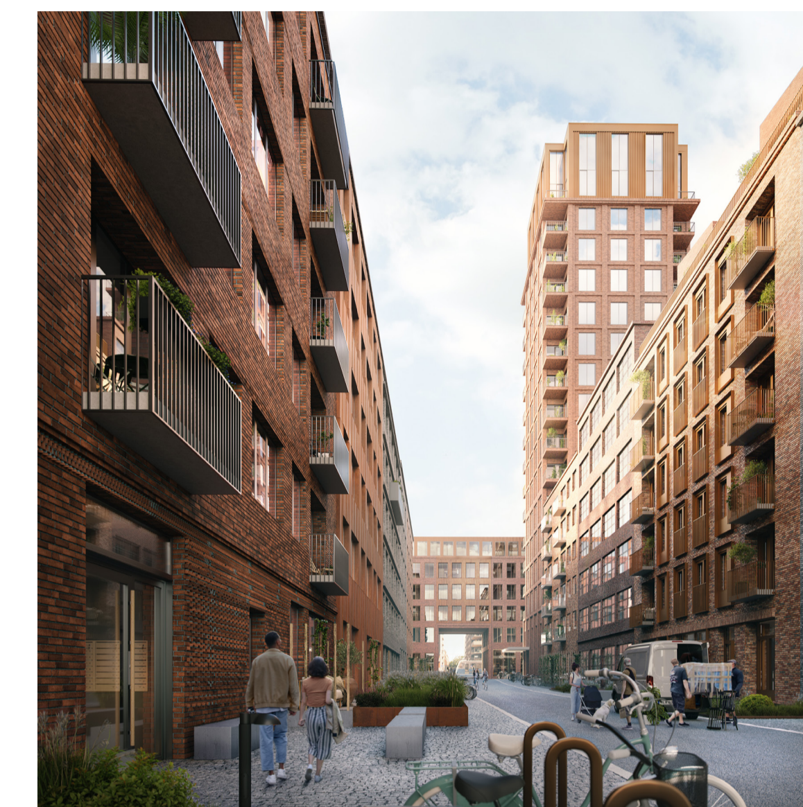
En av tvärgatorna, vy från söder, hög andel bostäder, begränsat med biltrafik, LiljewallArkitekter.